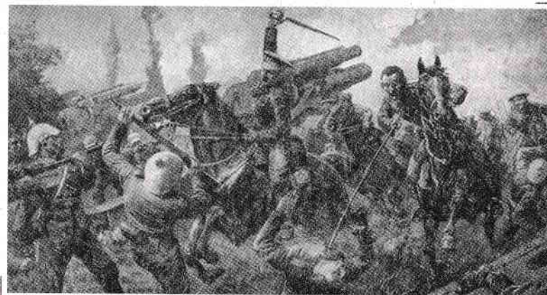
Soldații cavaleriei britanice atacând trupele germane la Mons

Când forțele militare germane au invadat Belgia în august 1914, planul acestora era să traverseze această țară și să ajungă în cea învecinată, Franța. De acolo, armata germană urma să cucerească Parisul – capitala Franței –, ceea ce i-ar fi permis să obțină controlul asupra unor regiuni importante din Europa.