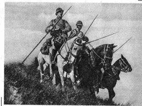
Cavaleriști francezi din Primul Război Mondial, înarmați cu lănci

Pe 21 august, Corpul Expediționar Britanic își stabilea pozițiile pentru a proteja armata franceză care se afla deja în zonă. Corpul Expediționar Britanic a trimis, de asemenea, o unitate de cavalerie – soldați călare – care să meargă dincolo de pozițiile Antantei și să depisteze forțele germane. Cavaleria spera să organizeze o ambuscadă și să alunge orice inamic din zonă. O ambuscadă este o capcană care, de obicei, implică soldați ce se folosesc de camuflaje (precum copaci, tufișuri și clădiri) pentru a lansa un atac-surpriză asupra inamicului.