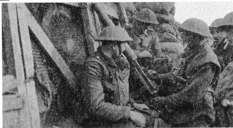
Soldați britanici din Primul Război Mondial într-o tranșee cu mitralieră

Apoi bătălia s-a îndreptat către orașul Mons.